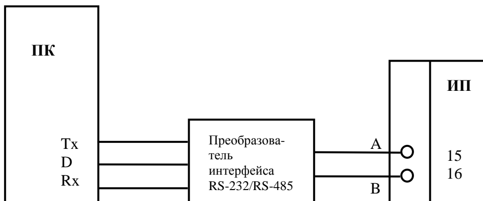
Рисунок А.1 – Схема подключения приборов при определении основной приведенной погрешности ИП